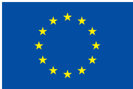
UNION EUROPÉENNE Fonds social européen